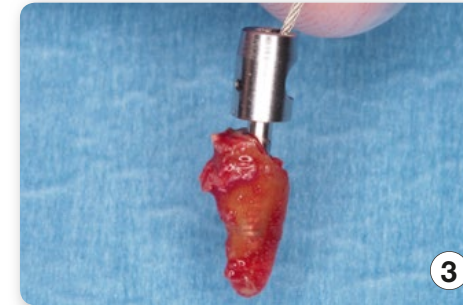
Der extrahierte Zahn mit Wurzel