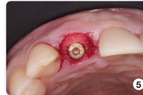
3D Positionierung des Implantats