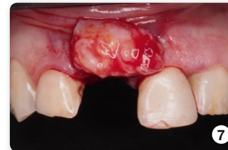
Positionierung des Transplantats