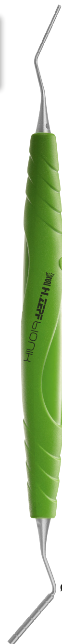
24.532.19 Titan Planstopfer Instrument

mit Graduierung 3/6/9/12/15 mm zur Tiefenmessung und für das Verdichten von Augmentationsmaterial am Implantat. BIONIK -Griff, gelbgrün.