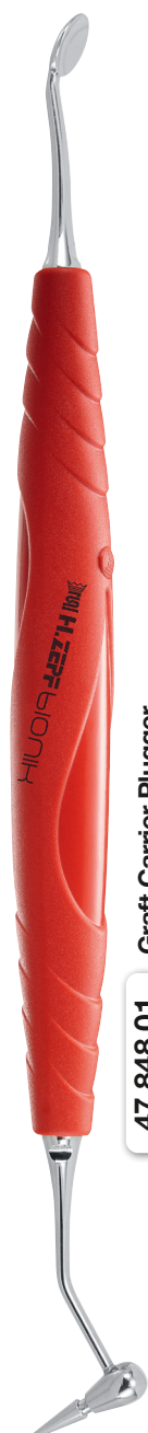
47.848.01 Graft Carrier Plugger

Stopfer/Löffel Kombination zum Konturieren und Einbringen von Transplantaten. BIONIK -Griff, hellrot-magenta.