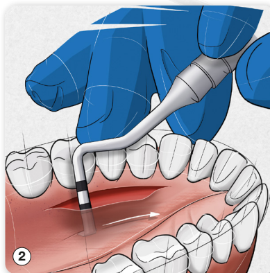
② Präparation zu BG-Gewinnung anhand des Instruments