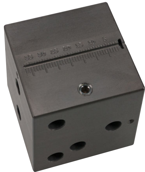
Lineal 37 mm, kalibriert